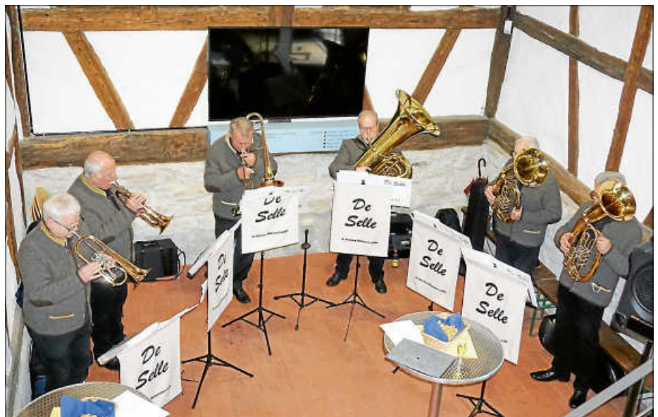
Die Wendlinger Bläsergruppe „De Selle“ sorgte für die musikalische Umrahmung.

keit. Früher hatte fast jeder Ort seine eigene Tracht. Heute ist dies leider zum Großteil in Vergessenheit geraten. Bürgermeister Steffen Weigel betonte bei seiner Rede, dass er die Tracht vor allem auch als „soziales“ Kleidungsstück schätzt, da alle Menschen die sie tragen gleich sind, egal ob reich oder arm. Etwas das man sich heutzutage auch oftmals wünschen würde.