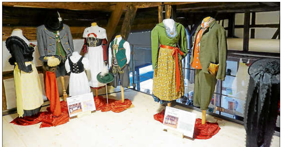
Bei einem Rundgang durch die Ausstellungsfläche können die unterschiedlichen Trachtenstücke genauer betrachtet werden.