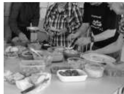
Jeder der Teilnehmer bringt etwas Leckeres für ein gemeinsames Büfett mit.