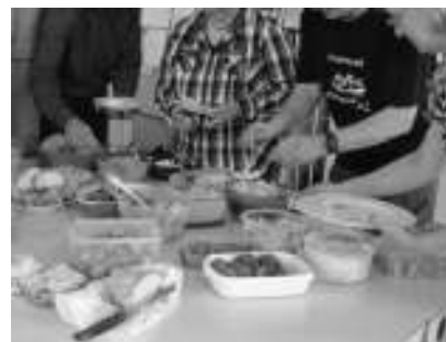
Jeder der Teilnehmer bringt etwas Leckeres für ein gemeinsames Büfett mit.