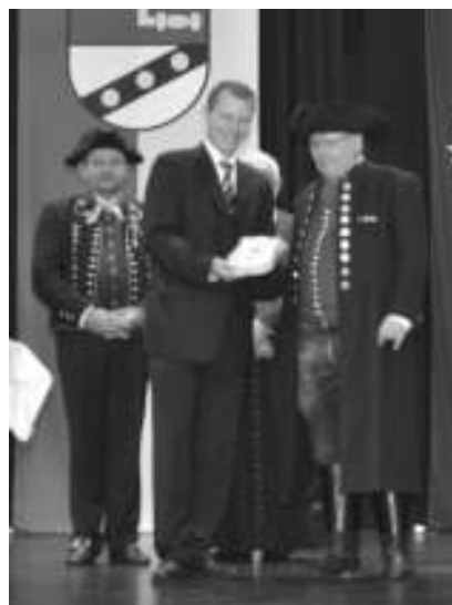
schönen Abend mit Egerländer Weisen.