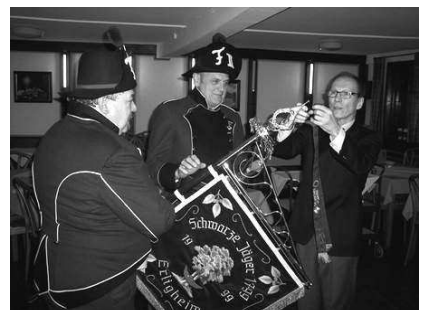
Bild: Überreichung des Fahnenbandes 2014 vom „Deutschen Komitee für Europäische Zusammenarbeit der Soldaten, Kriegsoffer und Förderer des europäischen Gedankens e.V.“