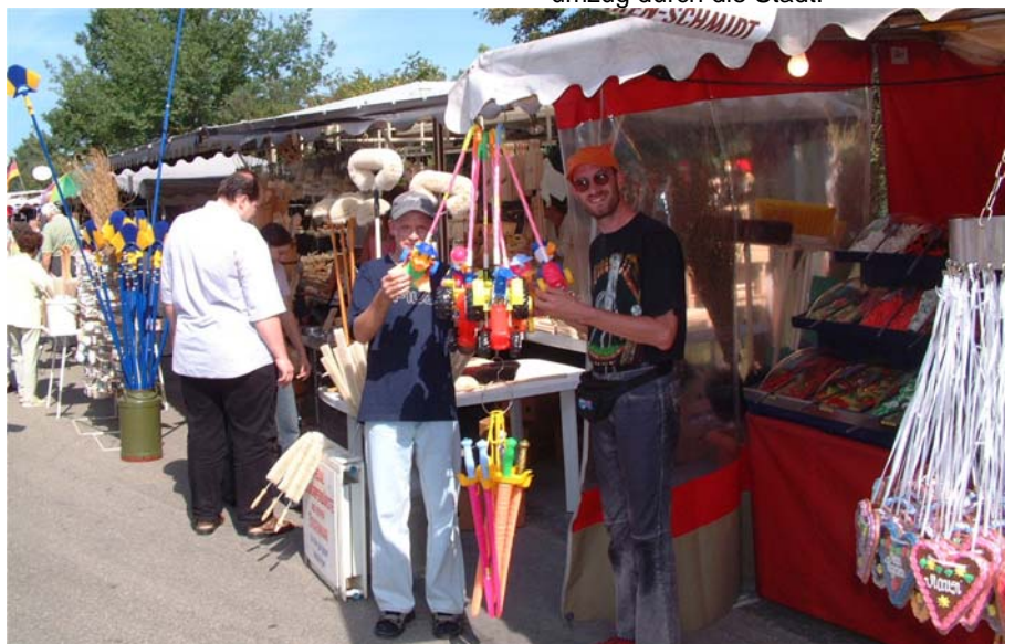
Mit rund 250 Ständen lud der Vinzenzmarkt auch in diesem Jahr wieder zum Kauf und Bummeln ein.