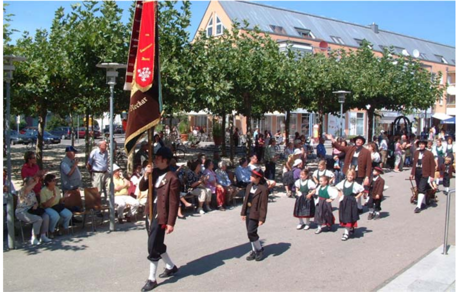
Die Egerländer Gmoi Wendlingen am Neckar konnten bei strahlenstem Sommerwetter die zahlreichen Festzug-Zuschauer grüßen.