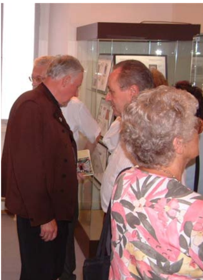
Im Stadtmuseum präsentiert die Egerländer Gmoi eine Sonderausstellung.