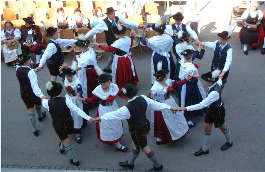
Nach dem Gottesdienst gab es Musik und Volkstänze vor dem Rathaus.