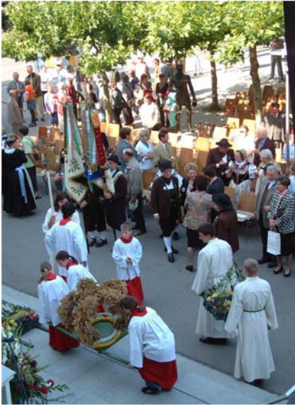
Vor dem Rathaus wurde der Erntedankgottesdienst gefeiert.