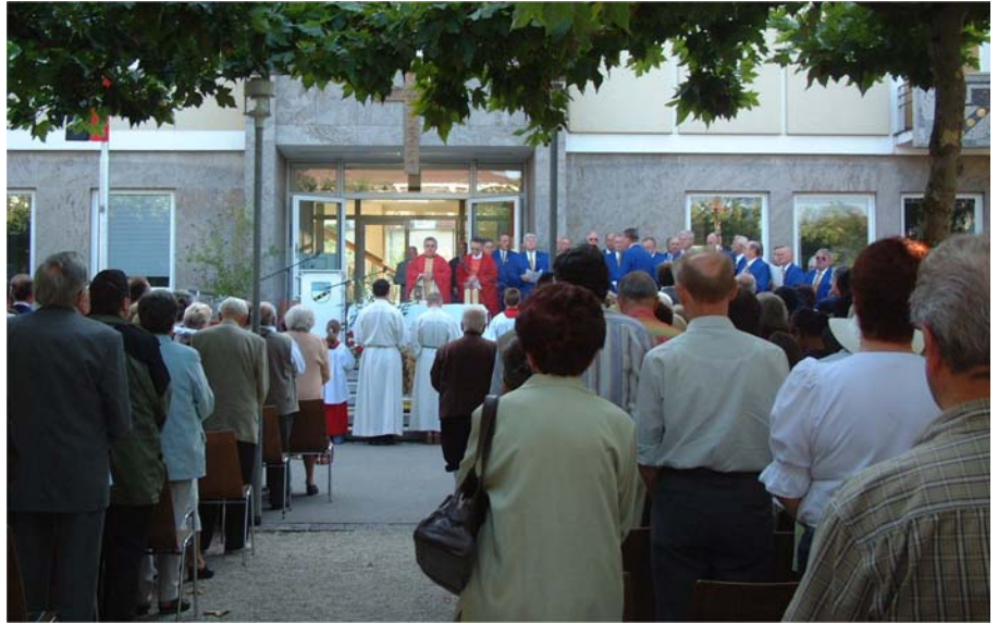
Zum ersten Mal in diesem Jahr konnten die Besucher der heilige Messe den Gottesdienst unter dem Platanendach des St.-Leu-la-Forêt-Platzes verfolgen.