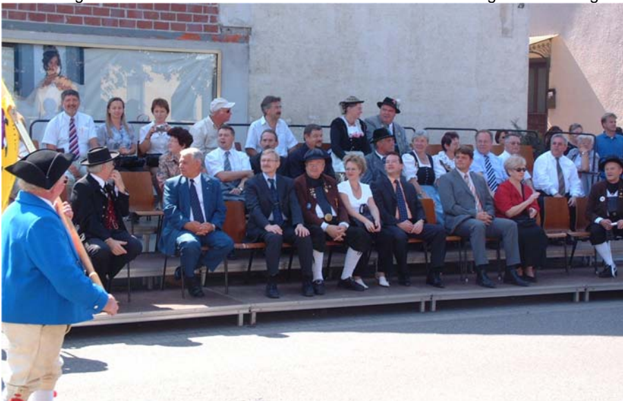
Die Ehrengäste begleiteten den Festumzug bis zur Ehrentribüne, von wo sie die restlichen Umzug verfolgten.