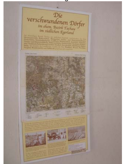
Gleich zwei Ausstellungen anlässlich des Vinzenzifestes sind in diesem Jahr im Rathaus zu sehen.