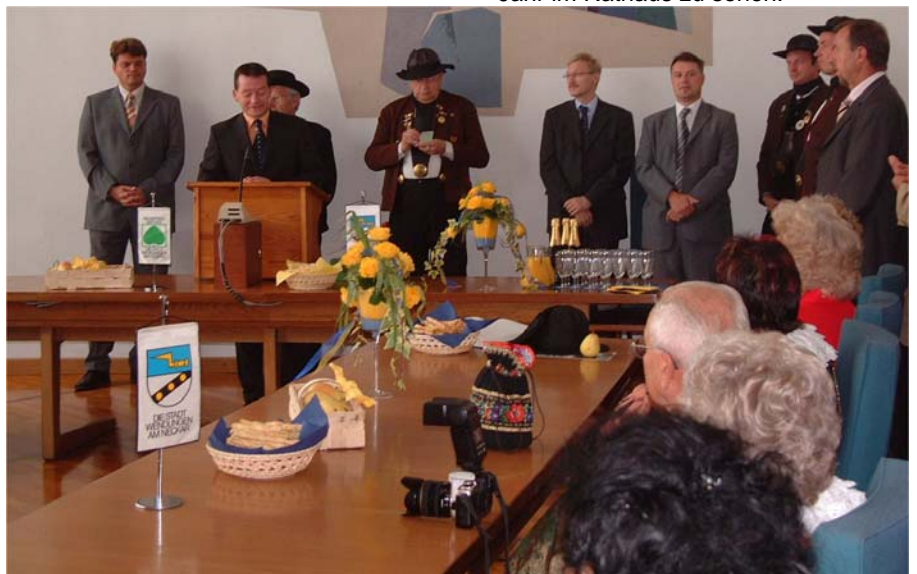
Bürgermeister Frank Ziegler begrüßte zahlreiche Gäste beim städtischen Empfang im Großen Sitzungssaal des Rathauses.