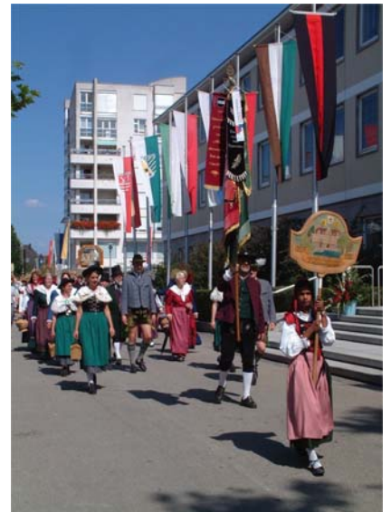
Rund 40 Gruppen zogen beim Festumzug durch die Stadt.