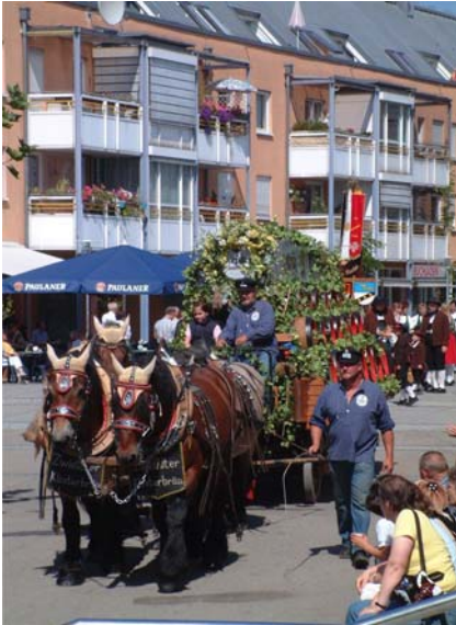
Die Zwifalter Brauereikutsche beim Festumzug.