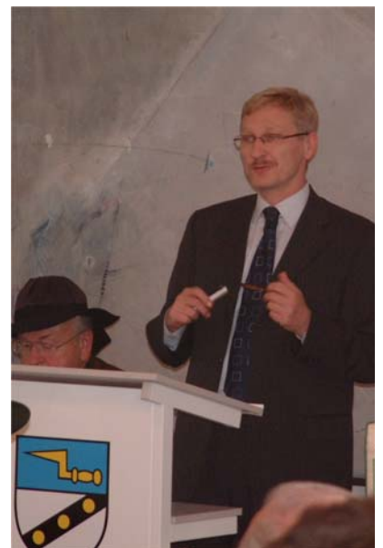
Oberbürgermeister Svoboda aus Cheb bei der Patenschaftsratsitzung